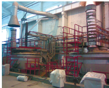
Рис.2. Печь в агрегатном исполнении ДППТУ-6АГ. ОАО «Сухоложский завод ВЦМ», Свердловская обл.

В ДППТУ-НП проводят технологические операции, рудный или кислородный кип, после расплавления металла и нагрева расплава до