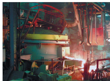
Рис.4. Миксер ДМПТУ-12. ОАО «Ярославский моторный завод»

При производстве стали из чугуна продувку чугуна кислородом с целью его обезуглероживания целесообразно заменить обезуглероживанием методом рудного кипа, ускоренного МГД перемешиванием расплава. Это позволяет вместо угара чугуна получить пригар и за счет этого увеличить выпуск стали на 15-20%.