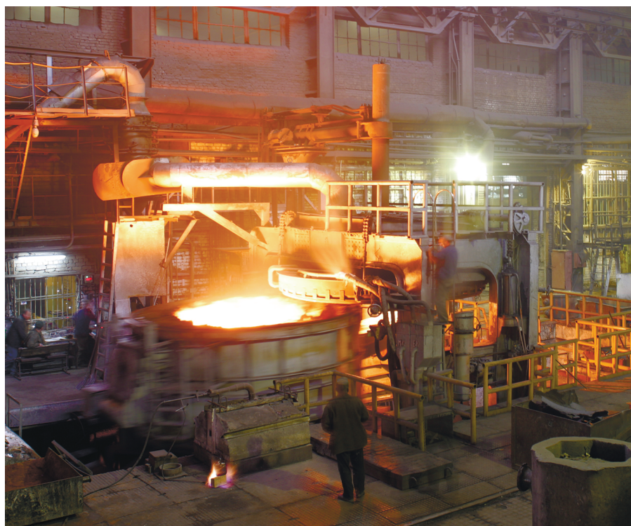
Рис. 1. ДППТУ-20. ОАО «Тяжпрессмаш», г.Рязань.

Они реализованы за счёт системы технических решений , (описанных ниже), где дуга постоянного тока является только одним из элементов системы . Особенно ярко выявляются преимущества ДППТУ-НП при реконструкции дуговых печей переменного тока ДСП с переводом их на питание постоянным током по методике «НТФ «ЭКТА» [Рис. 1] (см. разделы «Публикации» и «Отзывы» на сайте www.ntfecta.ru ). В результате замены любых дуговых печей переменного тока на ДППТУ-НП затраты окупаются за несколько месяцев.